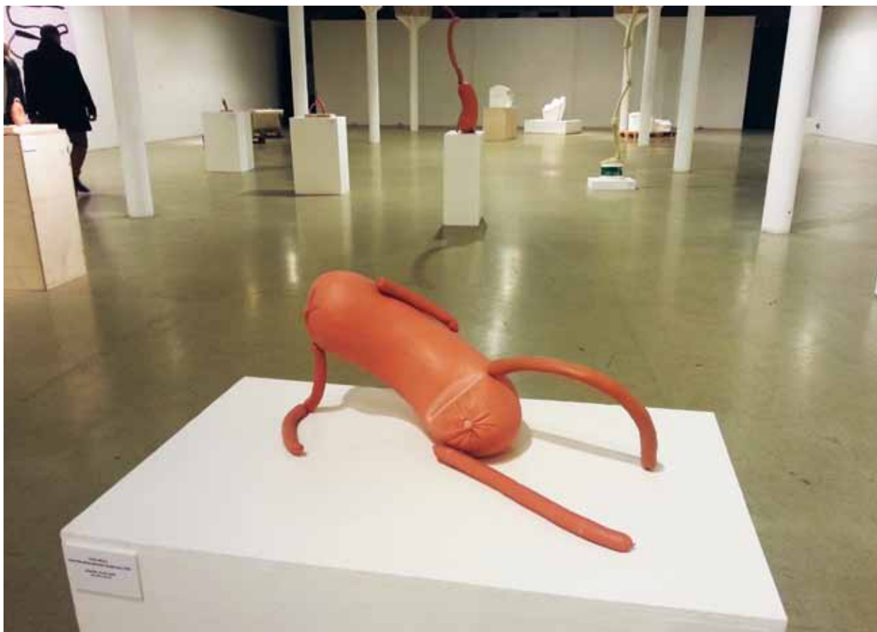
Special guest på Regina Gallery, Vinzavod. "Abstract Abstruse" Erwin Wurm, Österrike. ▶